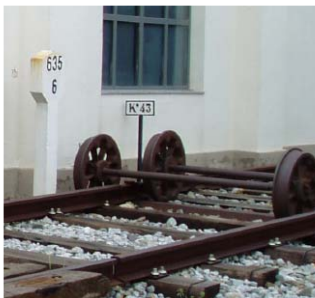
Eixos de dues rodes