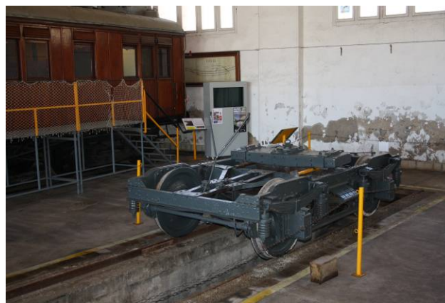
Bogie COSTA MZA 1209