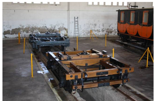
Imatges dels dos bogies de la col·lecció del museu