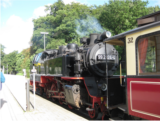
La locomotora 99 2324-4 de la MECKLENBURGISCHE BÄDERBAHN "MOLLI" en una de les activitats del 57è Congrés MOROP a Stralsund (Alemanya). Va ser estrenada el 10/07/2009.