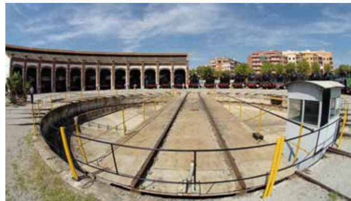
Rotonda del Museu del Ferrocarril de Catalunya.