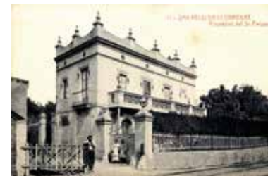
Can Fargas i pas de la via del futur passeig del Comte de Vilardaga, 1913.