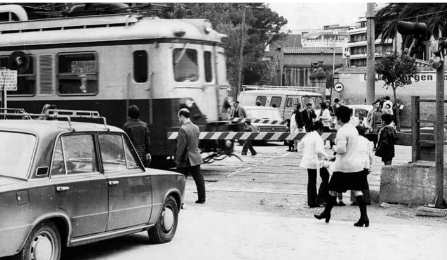
Pas a nivell del ferrocarril del passeig del Comte de Vilardaga. Octubre de 1976.